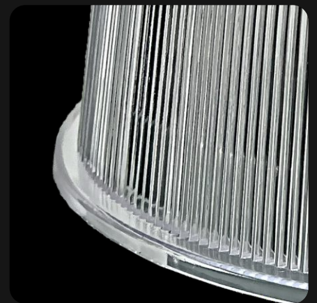
Garantía de 2 años