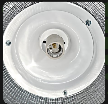
Compatibilidad con sockets