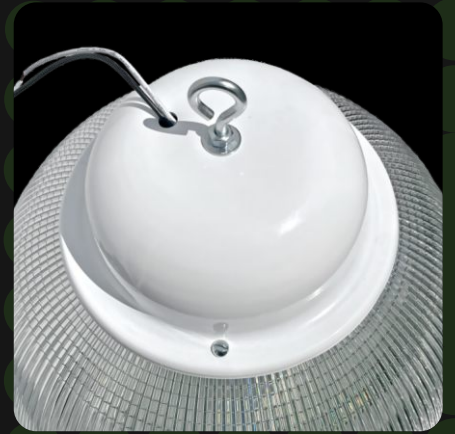
Difusor de acrílico