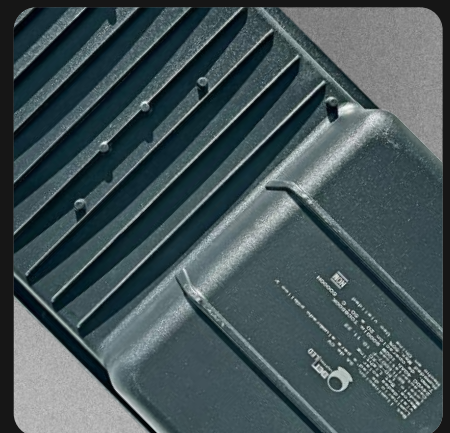
Carcasa en inyección de aluminio