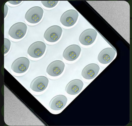
Difusor de cristal termotemplado