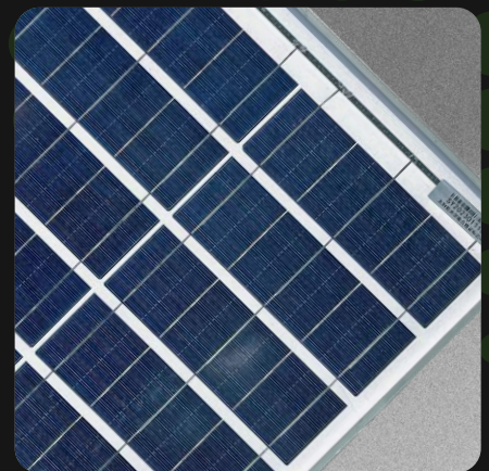
Panel de silicio monocristalino